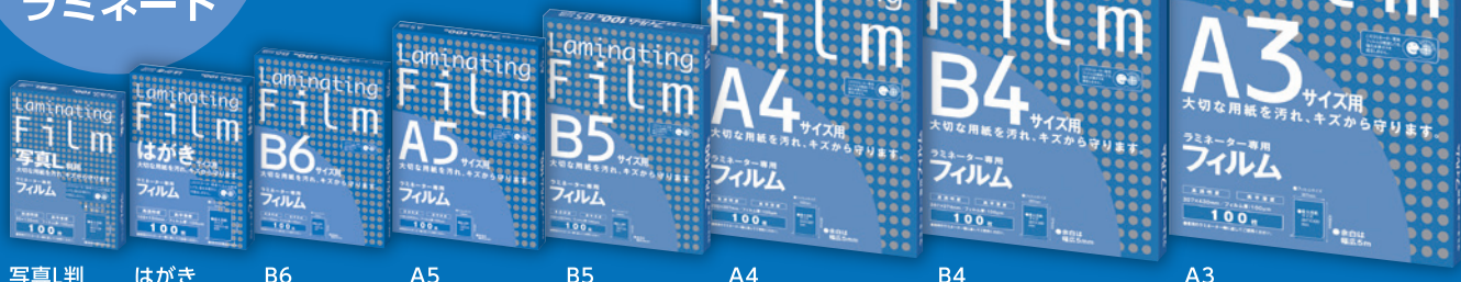
写真L判 はがき B6 A5 B5 A4 B4 A3