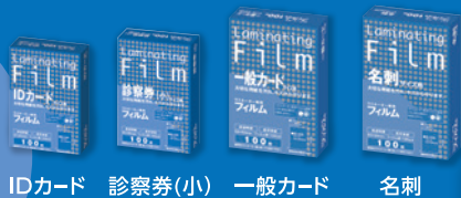
IDカード 診察券(小) 一般カード 名刺